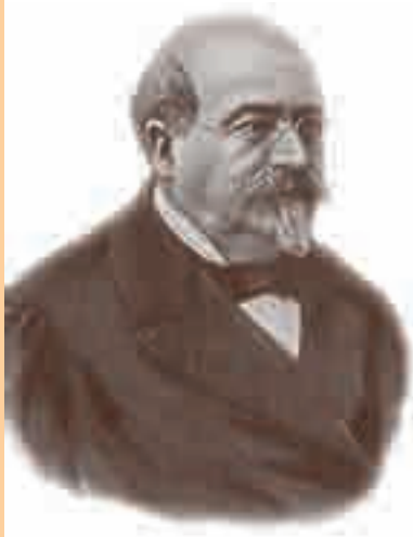
Mihail Kogălniceanu, prim-ministrul lui Cuza în perioada marilor reforme

Reformă = modificarea, transformarea (politică, economică etc.) unui domeniu menită să ducă la o schimbare în bine.