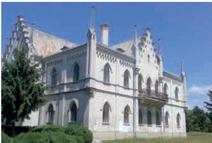
Palatul lui Alexandru Ioan Cuza de la Ruginoasa