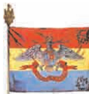
Steag tricolor din timpul domniei lui Al. I. Cuza