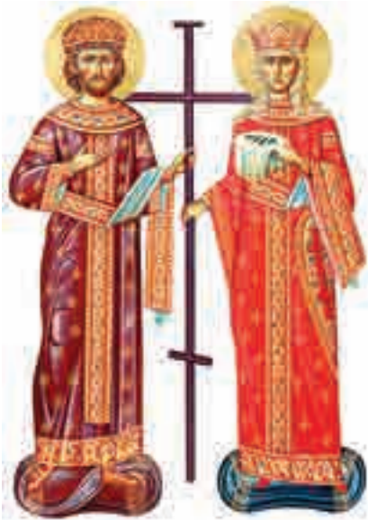
Sfinții Împărați Constantin și Elena (†21 mai)