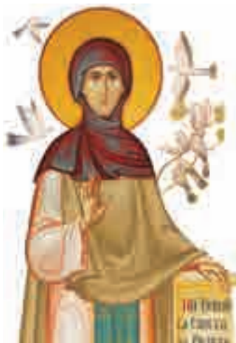
Sfânta Teodora de la Sihla (†7 august)