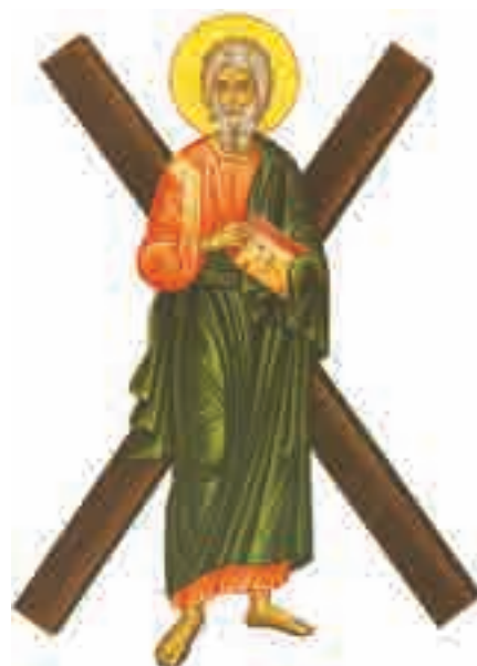
Sfântul Andrei (†30 noiembrie)

2. „Să păstrăm valorile țării!” Confeționează un afiș prin care îi îndemni pe cetățenii din localitatea ta să contribuie la protejarea unei biserici sau mănăstiri cu valoare istorică sau culturală pentru țară. Poți face apel și la autorități pentru a se implica în inițiativa ta.