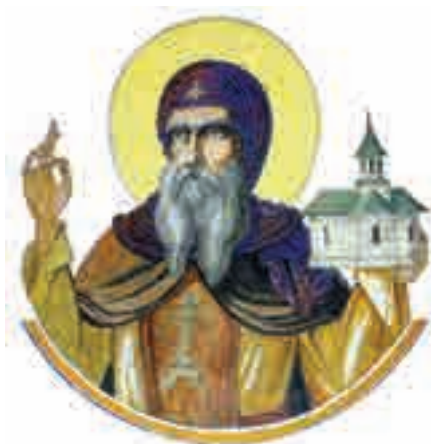
Sfântul Cuvios Nicodim de la Tismana (†26 decembrie)